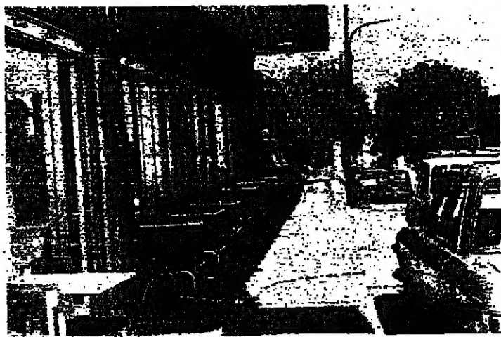
مقامي وصف حيلته ينتظر زوارها

حصاد تأمل ومناذاة على مدى حرب الستين عرض وتحليل لتقنية لبنان من خلال وجهة نظر الكاتب وحلفائها . أحداث لبنان : يوماً فيوماً في خلفياتها ودوافعها وسببها . كتاب ضروري لكل قارئ وباحث ومؤرخ . مشروبات دلا العمل توزيع المركز اللبناني لتوزيع المطبوعات هاتف : ٢٢٢٢٤٠